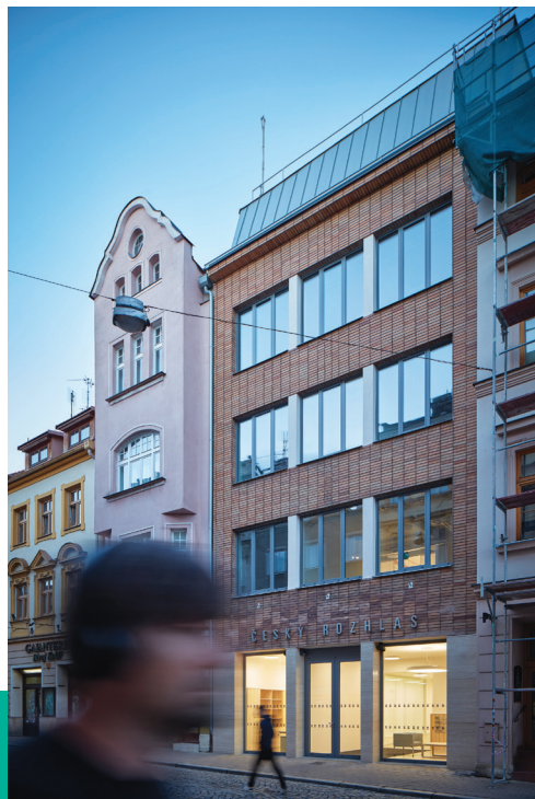
Funkcionalistická fasáda nové budovy Českého rozhlasu v Pavelčákově ulici.

Po roce 1989 sloužil dům jako prodejna a sklad textilu, než ho v roce 2018 zakoupil Český rozhlas a podle projektu opavského Ateliéru 38 začal na podzim 2020 s jeho rekonstrukcí, kterou provedla společnost Zlínstav.