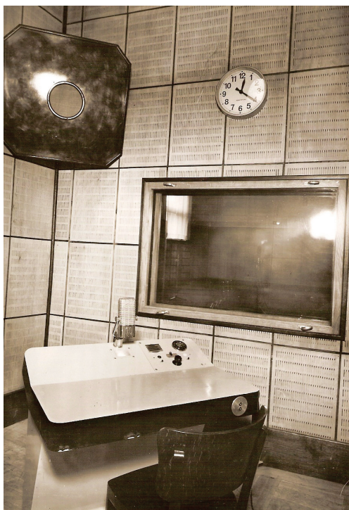
Stará hlasatelna Českého rozhlasu Olomouc na Horním náměstí.

V pondělí 3. ledna 1994 přesně ve 13 hodin začalo novodobé vysílání Českého rozhlasu Olomouc. Na jaře téhož roku byla opět zřízena slovesná redakce, která společně s hudební redakcí navázala na zpřetrhanou tradici. Vyprázdněná fonotéka se začala pozvolna zaplňovat novými pořady: dokumenty, četbami, dramaticizacemi, rozhlasovými hrami.