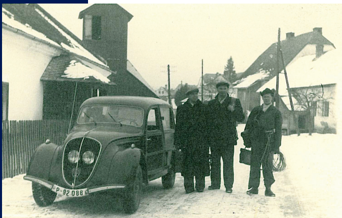
První přenosový vůz Československého rozhlasu Olomouc.