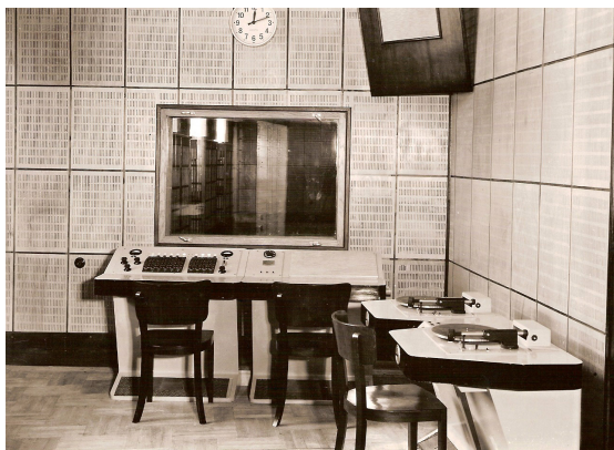
Vysílací pracoviště olomouckého studia na Horním náměstí – režie 1 v 50. letech 20. století.

Studio začalo vysílat v neděli 9. ledna 1949. Do poloviny října 1956 bylo sice personálně podřízeno Brnu, mělo ale svůj vlastní vysílací čas i možnost vstupu do celostátního programu.